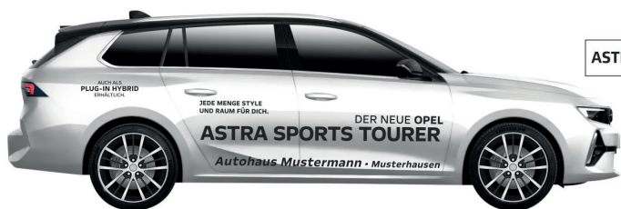
Art. Nr.: ASTRAST-ECO