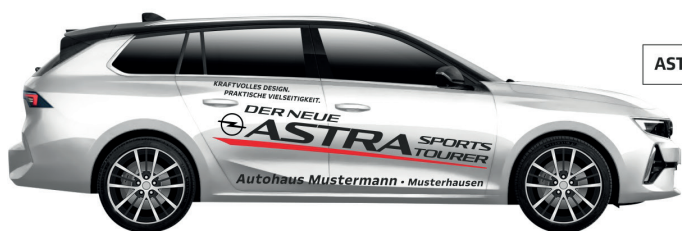
Art. Nr.: ASTRAST-01