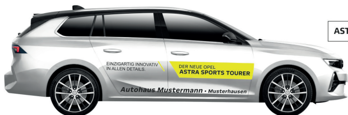
Art. Nr.: ASTRAST-03