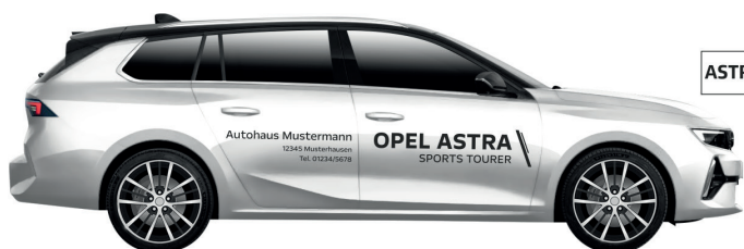
Art. Nr.: ASTRAST-MINI