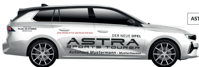
Art. Nr.: ASTRAST-02